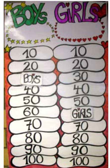
Beispiel für eine Punktwand